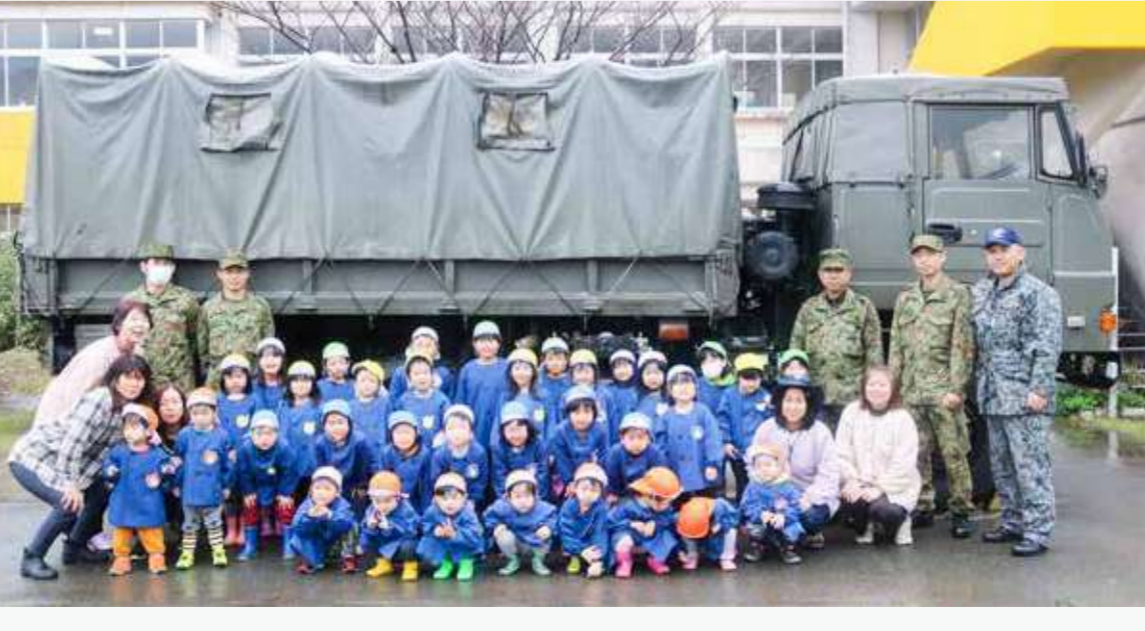
特別支援: 自衛隊熊本地方協力本部、熊本県警、ロアックン熊本