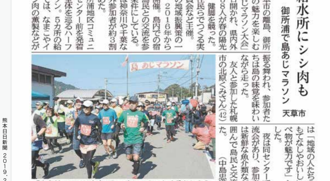
「島あじマラソン大会」で、一斉にスタートする参加者ら＝天草市

天草市の離島、御所浦町の魅力を味わう「島あじマラソン」大会が23日開かれ、県内外の138人が春の陽光の中、健脚を競った。地元住民らでつくる実行委員会など主催。島の地域振興策の一環で、2016年から毎年開催。島内の宿泊や島民との交流を参加の条件にしている。今回は神奈川や千葉など県外参加者が約3割を占めた。