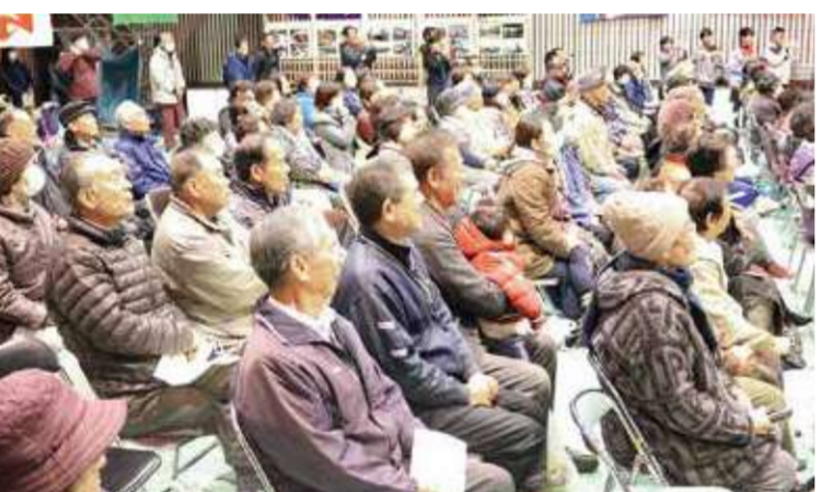
北体育館は200名以上の聴衆で満席