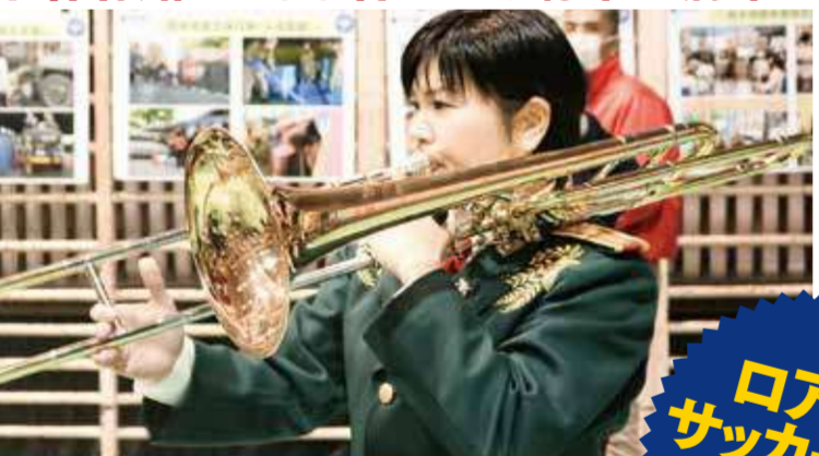
間近で見る生演奏は迫力満点！