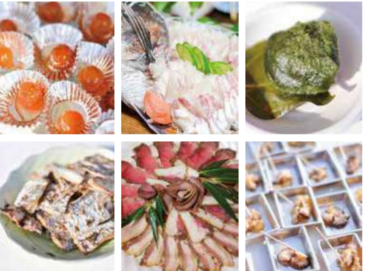
自然の恵み豊かな御所浦ならではの食材