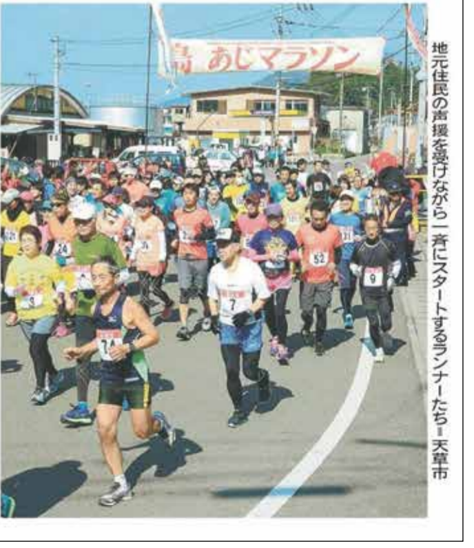
地元住民の応援受けながら一斉にスタートするランナーたち。天草市